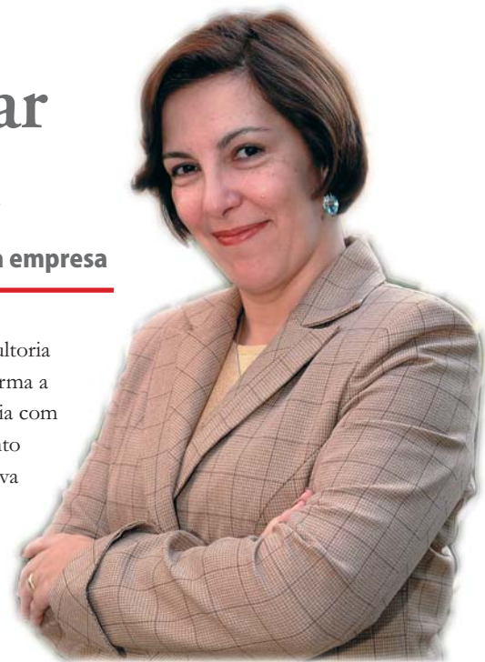
Fabíola: mau preposto causa prejuízo

Há termos que o preposto não pode utilizar, como “não sei”, “acho”, “mais ou menos”, “aproximadamente”. Deve estudar toda a rotina da empresa, os horários da jornada e do intervalo do empregado que move a ação trabalhista, as datas de admissão e saída da empresa. Tem de saber todos os benefícios pagos ao empregado, como vale-transporte, vale-refeição. “Em um caso em que o empregado pede equiparação salarial, por exemplo, o preposto deve estar preparado para responder questões sobre as atividades que ele desempenha na empresa, as atividades do paradigma, e saber enfatizar as diferenças entre eles, como o tempo em que cada um exercia a função e a qualificação técnica, experiência no setor”, diz.