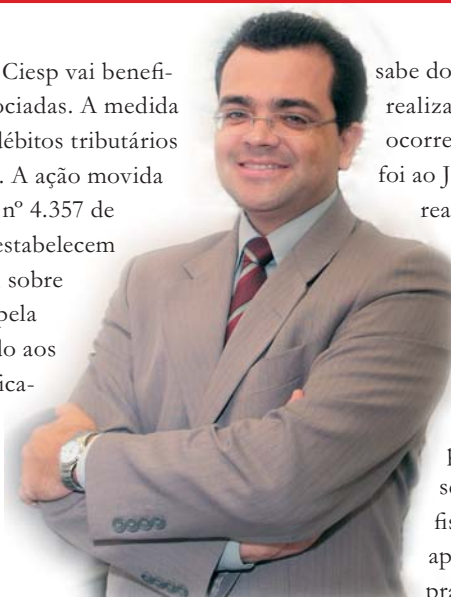
Anderson: liminar protege de risco iminente