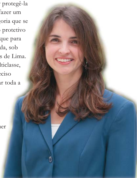
Mônica: registrar é um investimento

igual para todos) para emissão do certificado. Segundo a advogada, este documento dá o poder e o dever de zelar pela marca. O certificado atesta a exclusividade conferida pelo Inpi por dez anos. Ele é o órgão administrativo que tem a atribuição de apreciar se a marca é registrável. Já o órgão encarregado de punir por eventuais danos é o Judiciário. É ele também que tem o poder de rever a decisão administrativa.