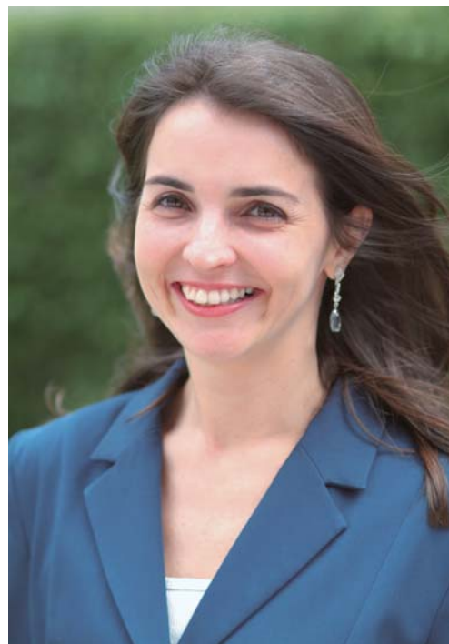
Mônica: marca pode ser eterna

A gigante da informática Apple, por exemplo, patenteou cerca de 200 inovações colocadas no celular i-phone, como a forma de abrir a imagem por meio da separação dos dedos encostados na tela. Não são apenas as marcas e patentes que podem ser protegidas. A empresa ou mesmo uma pessoa física também pode pedir o registro de um desenho industrial, que é uma apresentação artística, inovadora do produto. Por exemplo, uma alça diferente de bolsa, um novo modelo de calçado. É um conceito ligado à estética.