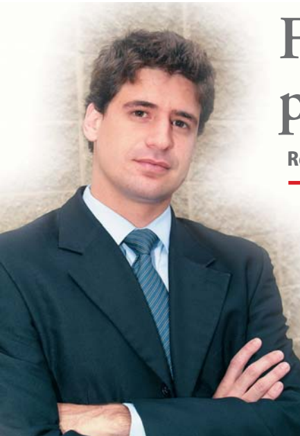
Finimundi: cautela na flexibilização