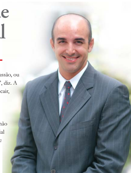
Ferreira: embargos sem garantir o juízo

Nova lei permite o parcelamento da dívida em até seis prestações